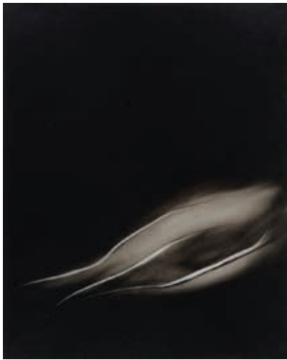
Fendre le limon ▲ Fusain et huile sur calque 36 x 29 cm 2025