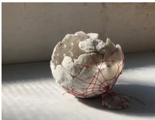
Sein ou utérus 1 ▲ Assemblage, collage d'éclats de marbre taillés et tissages de fils de coton Ø 15 cm 2025