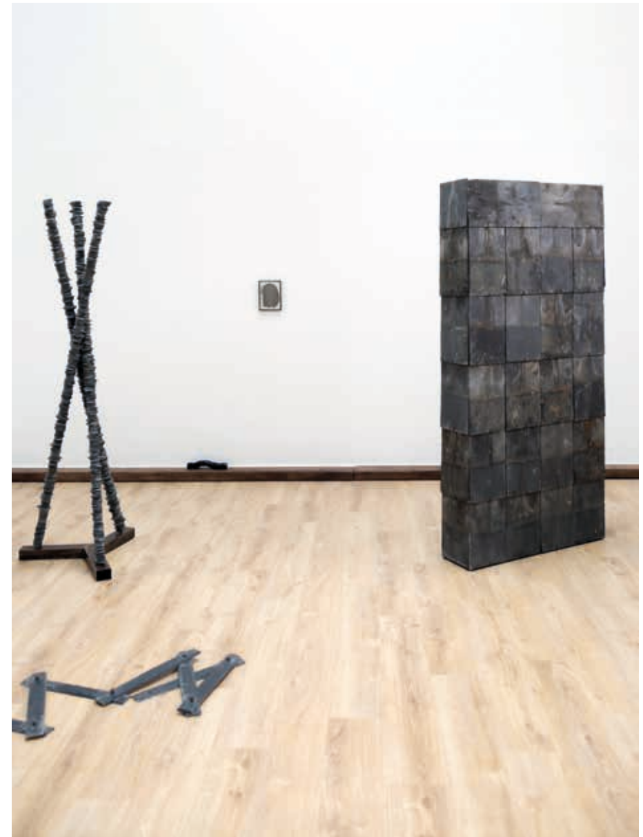
Grande Présence ▲ Ardoise bleu de Trélazé, acier (Première couverture de l'église de Ménilmontant) 220x100x26 cm 2025