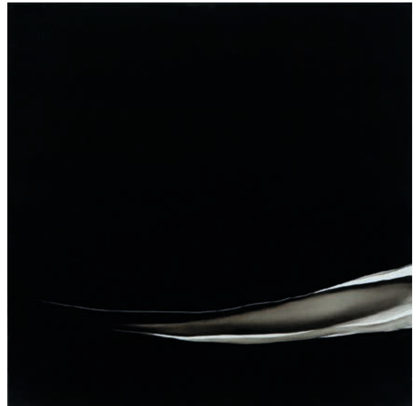
Échos 8 ▲ Huile sur toile 70 x 70 cm 2018