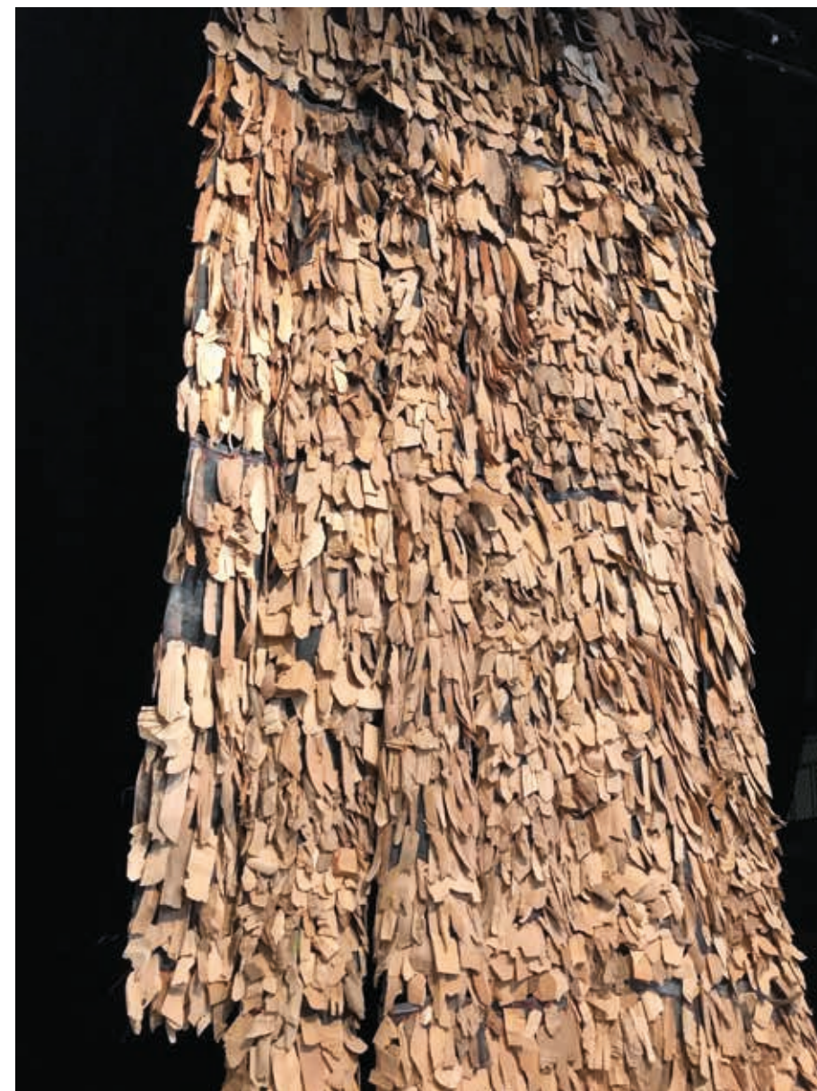
Le temps d'un geste 5 ▲ Assemblage (couture sur structure grillagée) de copeaux de bois de sculpteurs, essences diverses 400x170 cm 2015