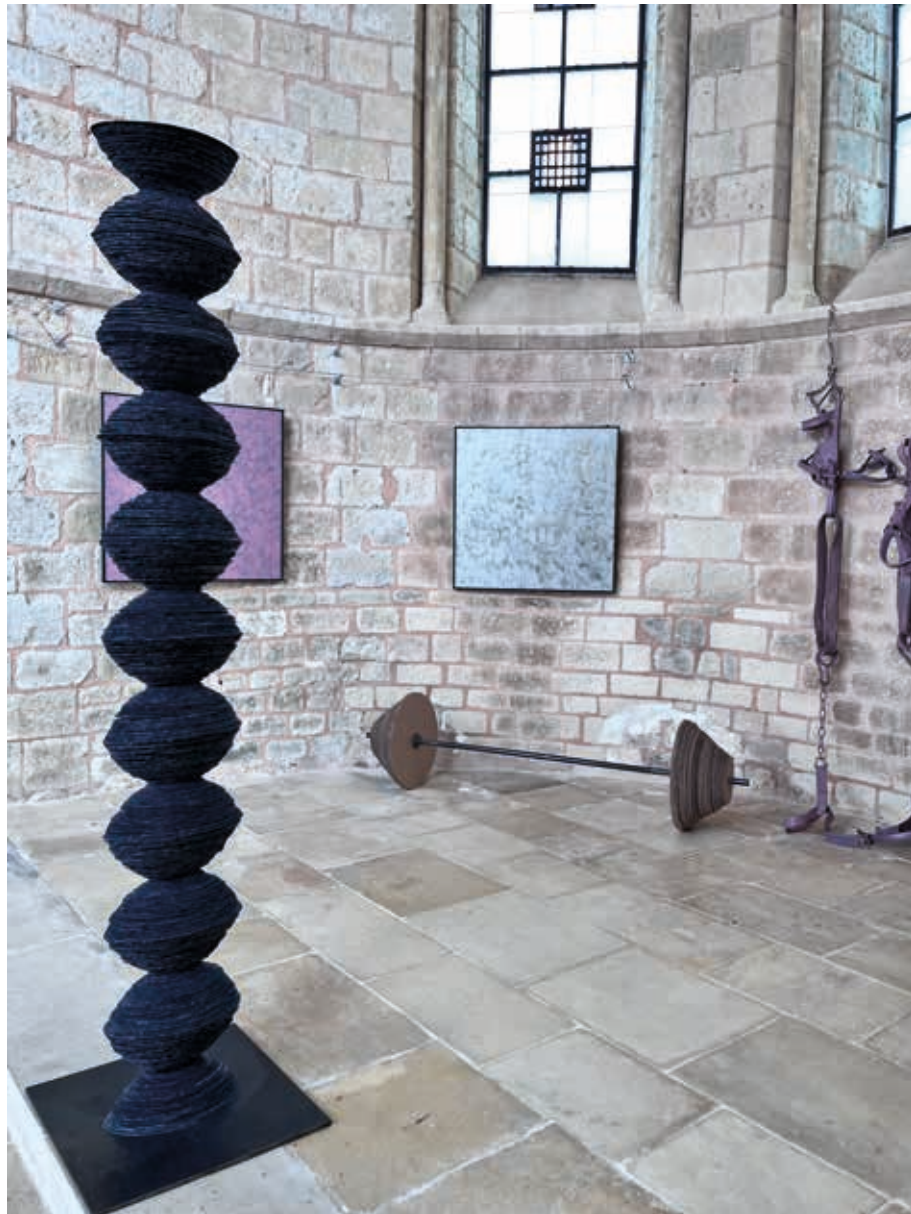
Sculpter Sans Fin ▲ Ardoise bleu de Trélazé, acier 210x50x50 cm 2026