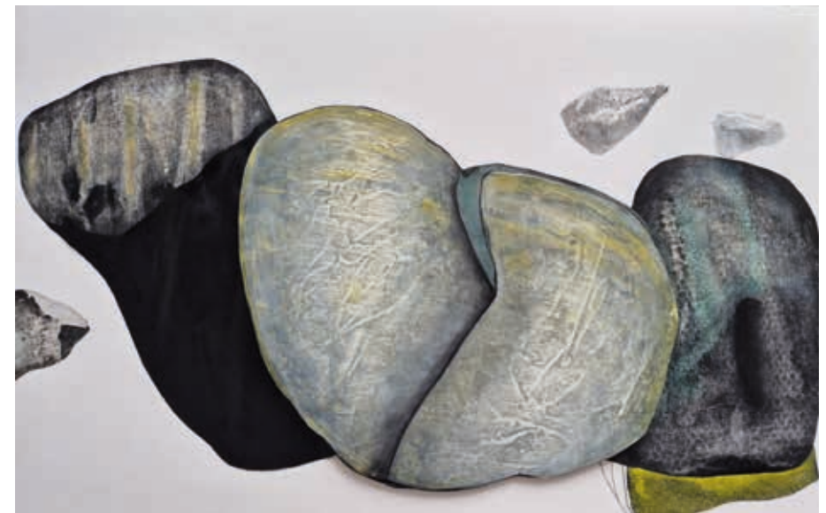
Sans titre ▲ Technique mixte sur papier 300g marouflé sur carton bois 80x120 cm 2025